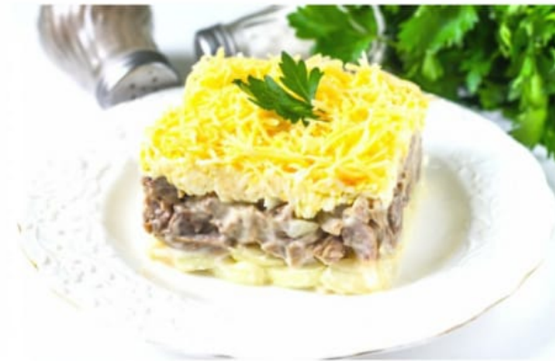
Салат "С курицей и черносливом" 400руб(180гр)