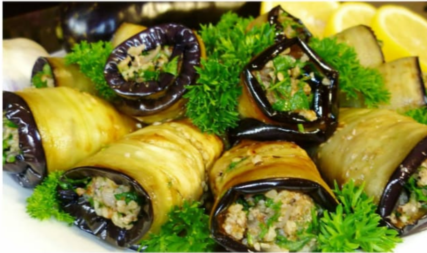
Рулетики из баклажанов с сыром и орехами 900руб (500гр)