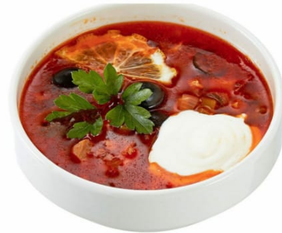
Солянка “Праздничная” 500руб (350гр)