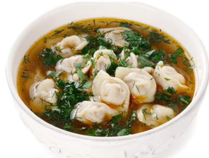
Пельмени “Самолепные” с бульоном и зеленью 500руб (350гр)