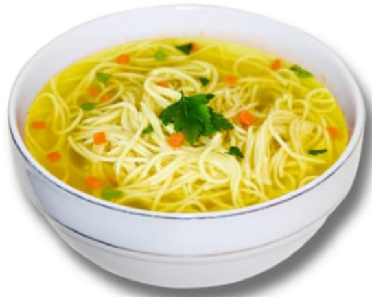
«Тукмас» с курицей 450руб (350гр)