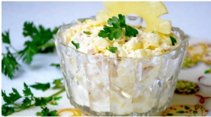
Салат "Экзотика с курицей и ананасами" 400руб (180гр)