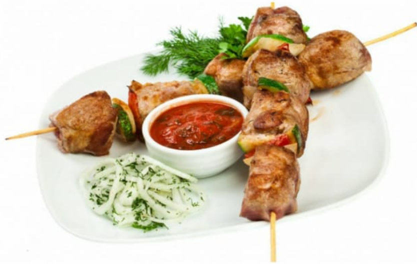
Шашлык "куриный" 200руб (100гр)