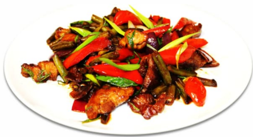
Салат теплый с говядиной “по Тайски” 400руб (180гр)