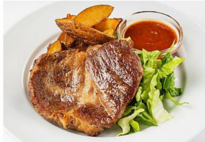
Корейка "Сочная" на кости 1300руб (550гр)