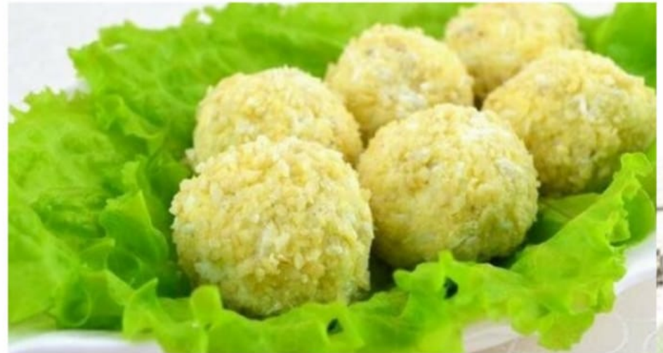
Сырные шарики 900руб (8шт)