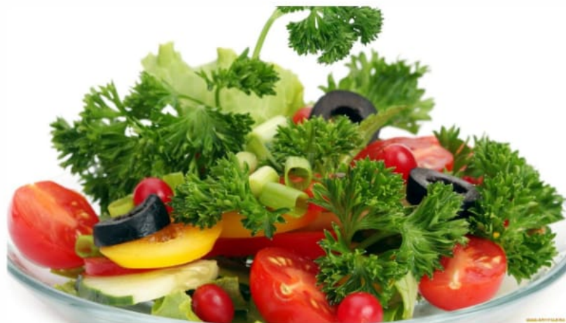
Салатик "Овощной" 100руб (100гр)