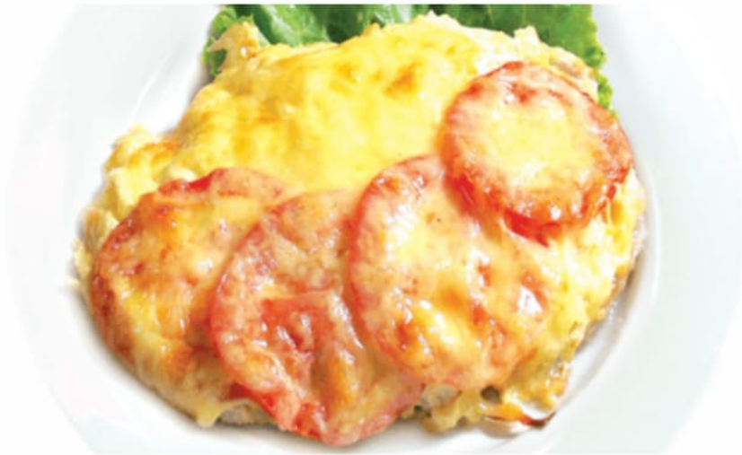
Куриная грудка "Восторг" с помидорами и сыром 900руб (450гр)