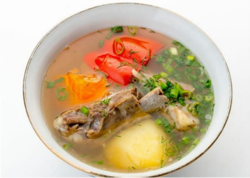
Шурпа “Восточная” с говядиной 500руб (350гр)